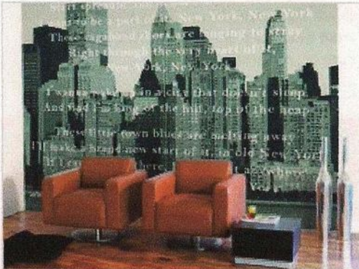
תמונת קיר להדבקה של EIFFINGER. עולה הרבה פחות מלהרוס קירות

מומחי עיצוב ואדריכלות טוענים כי שידרוג החלל ושיפוץ הבית אינם בהכרח פונקציה של כסף, אלא של מחשבה