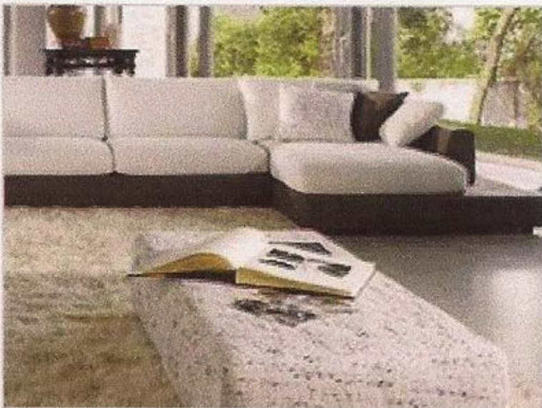
ספה ארוכה של נטוצי