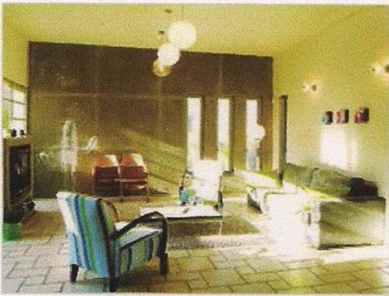
ריהוט משולב בבית שעיצבו האדריכליות שרון נוימן ונפי חותם